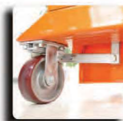
自动刹车系统-选配